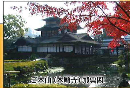
ご本山(本願寺) 飛雲閣

①団体航空運賃・空港使用料 ②新幹線運賃・指定席特急料金 ③宿泊代(朝食付き3泊、2名1室)(シングルをご希望の方は3泊で20,000円追加にてお受けします) ④貸切バスまたはジャンボタクシー代、高速代、駐車代(1日目と4日目のみ) ⑤食事代:朝食3回、昼食3回、夕食3回(飲物代は含みません) ⑥旅行傷害保険、航空機欠航保険 ただし、行程表中に…で示した移動(タクシー代など)は含みません。