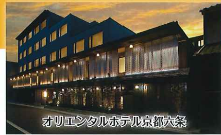
オリエンタルホテル京都六条